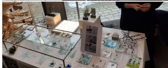
Glasfusingstand mit Künstlerin