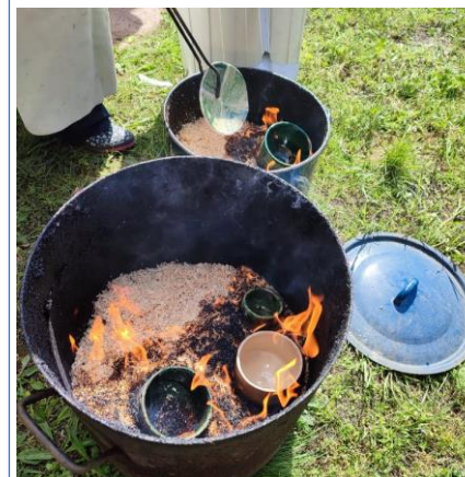
Raku-Brand in Bliesendorf